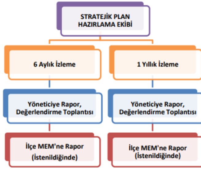
Tablo 34: 2024-2025 Eğitim Öğretim Yılı Stratejik Plan İzleme ve Değerlendirme Tablosu

Stratejik planın izlenmesinde 6 aylık dönemlerde izleme yapılacak denetim birimleri, il ve ilçe millî eğitim müdürlüğü ve Bakanlık denetim ve kontrollerine hazır halde tutulacaktır. Yıllık planın uygulanmasında yürütme ekipleri ve eylem sorumlularıyla aylık ilerleme toplantıları yapılacaktır. Toplantıda bir önceki ayda yapılanlar ve bir sonraki ayda yapılacaklar görüşülüp karara bağlanacaktır.